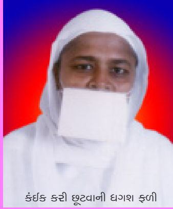
કંઈક કરી છૂટવાની ઘગશ ફળી

આ મહાનિબંધ પૂજ્ય મહાસતીજીએ ડૉ. કુમારપાળ દેસાઈના માર્ગદર્શન હેઠળ તૈયાર કર્યો હતો.