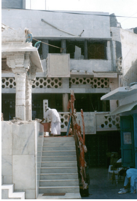
દેરાસરની મહત્તાને ઢાંકી દેતાં આડેધડ બાંધકામો

ત્રિપરિમાણીય રચનાઓમાં એક તરફ મૂર્તિકળા આવે જેમાં માત્ર દૃશ્ય અનુભૂતિ મહત્વની ગણાય અને બીજી તરફ યાંત્રિક રચના આવે જેમાં માત્ર કાર્યક્ષમતાને મહત્વ અપાય. સ્થાપત્ય એ આ બંને ધ્રુવ વચ્ચે વિસ્તરેલી કળા છે જેમાં દૃશ્ય અનુભૂતિને પણ મહત્વ અપાય છે અને કાર્યક્ષમતા – ઉપયોગિતાને પણ. આ દૃશ્ય અનુભૂતિ અને કાર્યક્ષમતા; બંનેને કેટલું મહત્વ આપવું તે મકાનના પ્રકાર ઉપર અવલંબે છે. ઔદ્યોગિક મકાન એટલે કે ફેક્ટરીમાં દેખાવ કરતાં જરૂરી કાર્યક્ષમતાને વધારે પ્રાધાન્ય અપાય તે સ્વાભાવિક છે. કારણ કે આવી કાર્યક્ષમતા સિદ્ધ કરવા જ તે મકાનની રચના થાય છે. તેની સામે મંદિર, દેરાસર કે ગિરજાઘરની રચનામાં દેખાવ વધારે અગત્યનો ગણાય છે. આ મકાનોમાં દૃશ્ય અનુભૂતિ દ્વારા તત્ત્વજ્ઞાન તથા આધ્યાત્મિકતાનાં વિવિધ પાસાં પ્રતીકાત્મક રીતે રજૂ થાય છે. આવી રજૂઆતમાં સ્વાભાવિક રીતે જ જે તે પરિસ્થિતિ સાથેનો દૃશ્ય-સંપર્ક મહત્વનો