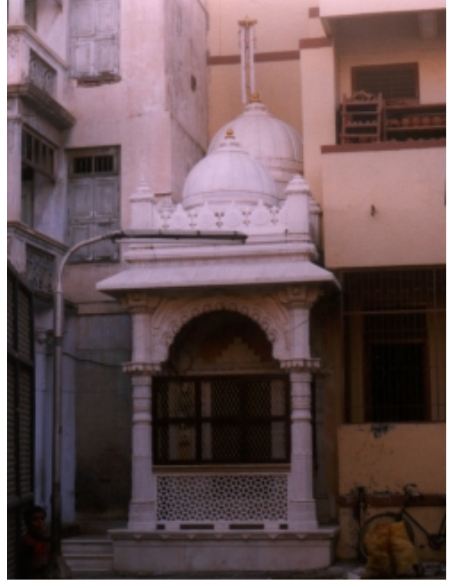
કેટલીક વખત પરિસ્થિતિવશ મકાનો વચ્ચે 'સેન્ડવિચ' થઈ જતાં દેરાસરો

ધ્યાનમાં આવેલો, ભૂજ શહેર મધ્યે એક દેરાસરના જીર્ણોદ્ધારમાં તેની ચોતરફના પગથિયાં એટલાં વિસ્તૃત સૂચવવામાં આવેલાં કે તે પગથિયાં સામે મૂળ દેરાસર પણ પ્રમાણમાપમાં વામણું લાગે.