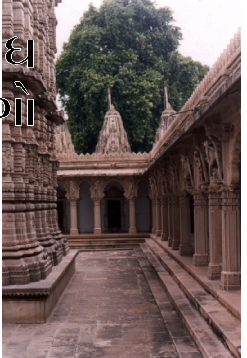
ભમતી : દેરાસરના પરિસરમાં શુદ્ધતા અને આધ્યાત્મિકતાની ભાવનાને જાળવી રાખે છે.

ઉદયદર્શન અર્થાત્ દેરાસરની ઊંચાઈ બાબતે જે નવ અંગો સ્થપતિ દ્વારા ધ્યાનમાં રખાય છે તેમાં નીચે જણાવેલ રચનાઓનો સમાવેશ થાય છે. (૧) જગતી - જે વિષે આપણે ગયા લેખમાં ચર્ચા કરી. આ જગતીમાં તેની પરિમિતિ પર આવેલ ઊભણી તથા સ્થિરશિલા કે ખરશિલા અર્થાત્ તેના મથાળા સુધી પાણી-ચૂના-