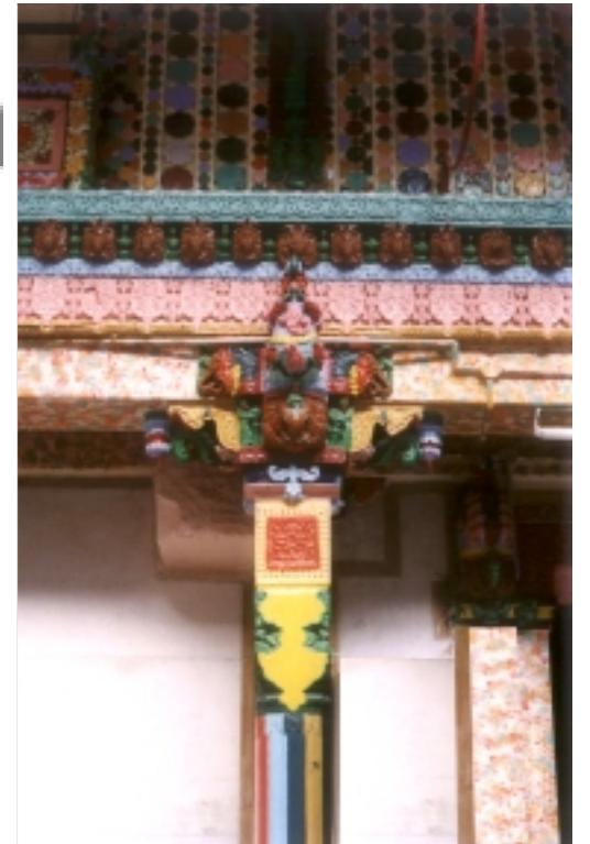
જગવલ્લભ પાર્શ્વનાથના દેરાસરની સમૃદ્ધ કાષ્ટ કોતરણી : શું હવે પછી આ પ્રકારની કળાઓ માત્ર ઇતિહાસ જ બની રહેશે?

૪૬૦ વર્ષ જૂનું આ દેરાસર માત્ર અમદાવાદના જ નહીં પણ સમગ્ર ગુજરાતના સ્થાપત્યના વારસાનો અમૂલ્ય નમૂનો છે. સમાજ તેની યોગ્ય કિંમત આંકે તે જરૂરી છે.