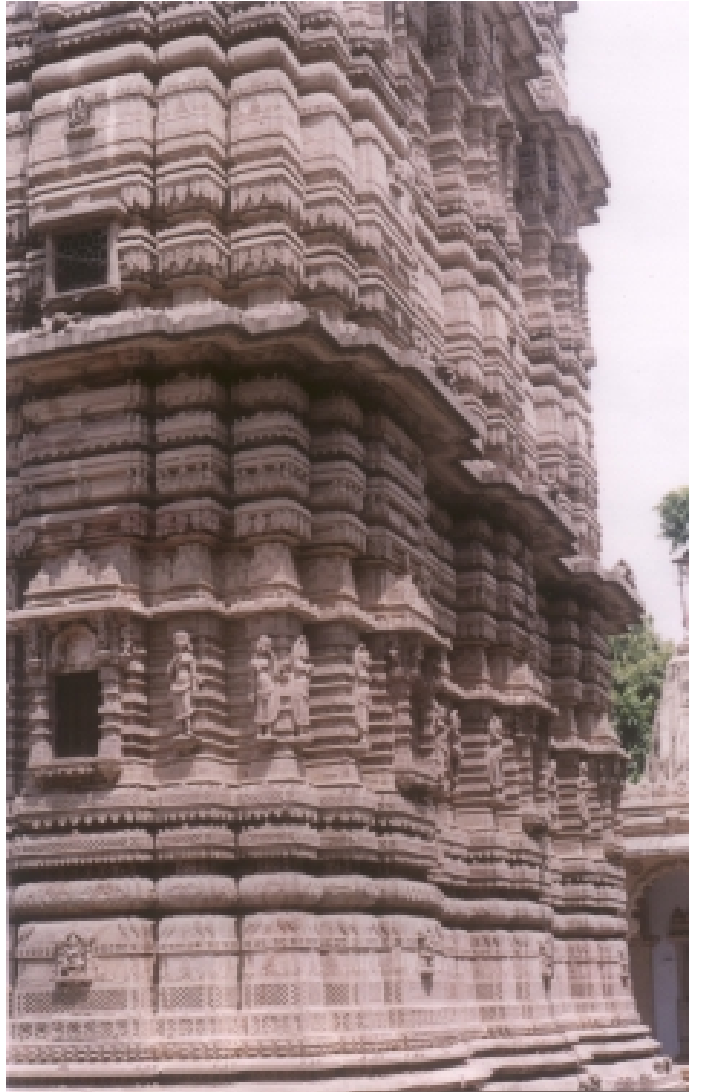
આને ભવ્ય કહીશું કે દિવ્ય? ભારતીય શિલ્પકળાનું એક અણમોલ નજરાણું

મંડોવર થકી સમગ્ર પ્રાસાદને ઊંચાઈ મળતી હોવાથી તેની દૃશ્ય-અનુભૂતિ તથા તેમાં થતી પ્રતીકાત્મક રજૂઆત મહત્વની ગણાય છે. વળી રોજિંદી આવનજાવનમાં પણ મંડોવર નયન સ્તરે આવેલ હોવાથી તે ખાસ નજરે ચઢે. એમ બની શકે કે પીઠ કે જગતીની કોતરણી નજરે ન ચડે પણ મંડોવર પર તો સહજમાં જ નજર પડે છે, અને તેથી તેની રચનામાં શાસ્ત્રીય પ્રમાણમાપ વપરાય તે જરૂરી છે.