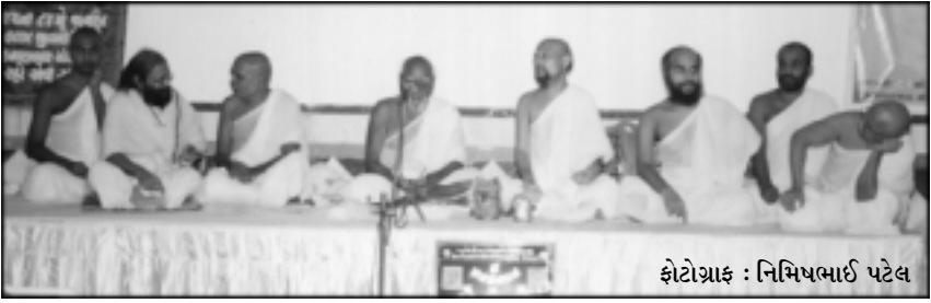
અમદાવાદના આંગણે પૂજનીય યોગદિવાકર આચાર્ય શ્રી વિજય આનંદઘનસૂરીશ્વરજી મહારાજશ્રીના ૮૪મા જન્મદિવસ નિમિત્તે થયેલી ભવ્ય ઉજવણીમાં ઉપસ્થિત મુનિગણની એક ઝલક

છે તેનું નિરૂપણ કરીને શ્રોતાઓને રસતરબોળ કર્યા હતા. તેઓશ્રીએ કહ્યું હતું કે જૈન મુનિઓ ક્યારેય ચમત્કાર કરતા નથી, પણ તેમના નૈષ્ઠિક ચારિત્રબળ અને કઠોર સાધનાના કારણે કંઈક એવું બને છે કે જે આપણને ચમત્કાર લાગે છે.